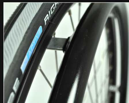
Tetra Grip drivring som ersätter Geléplast